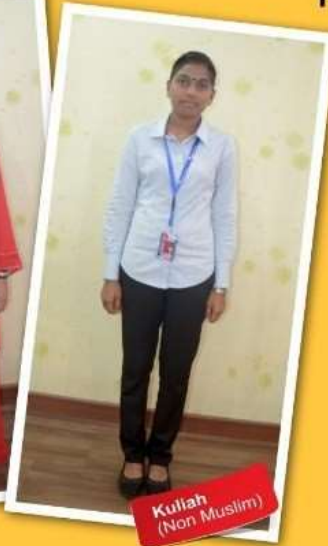
Kuliah (Non Muslim)